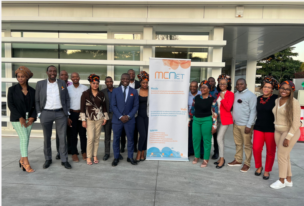
COLABORADORES MCNET, SA DIA DE ÁFRICA.

O Governo moçambicano, em coordenação com a União Africana, realizou a 25 de Maio do corrente ano, as celebrações dos 60 anos da União Africana, as cerimónias centrais, tiveram lugar no Centro de Conferências Joaquim Chissano, na cidade de Maputo. Sob o tema “Aceleração da Implementação da Zona do Comércio Livre Continental” , o evento contou com a parceria da MCNet, SA.